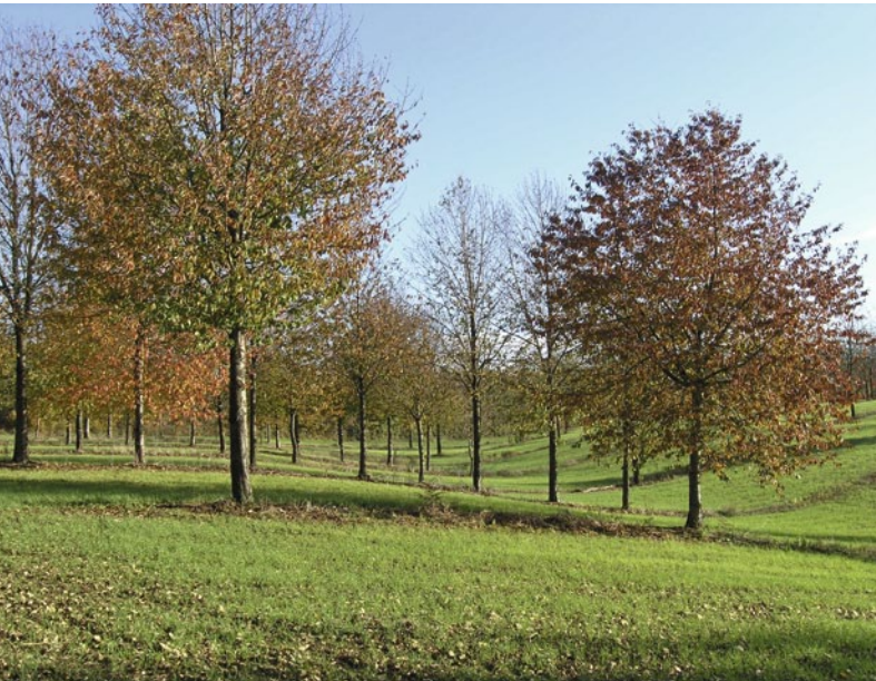
Abb. 1 | Vogelkirschen zur Wertholzproduktion in Frankreich.

Auskünfte: Felix Herzog, E-Mail: felix.herzog@art.admin.ch, Tel. +41 44 377 74 45