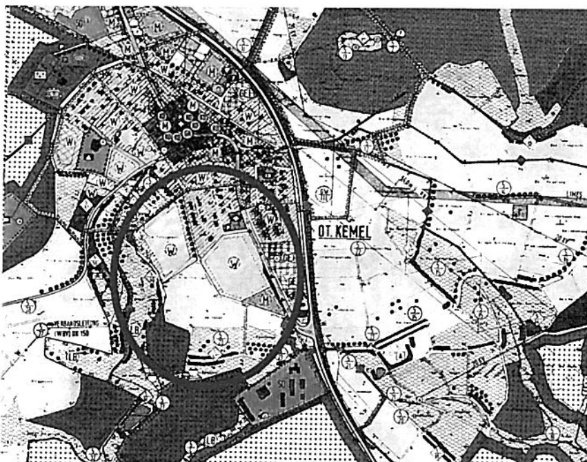
Flächennutzungsplan Gemeinde Heidenrod 1997, Ausschnitt Kemel, ohne Maßstab