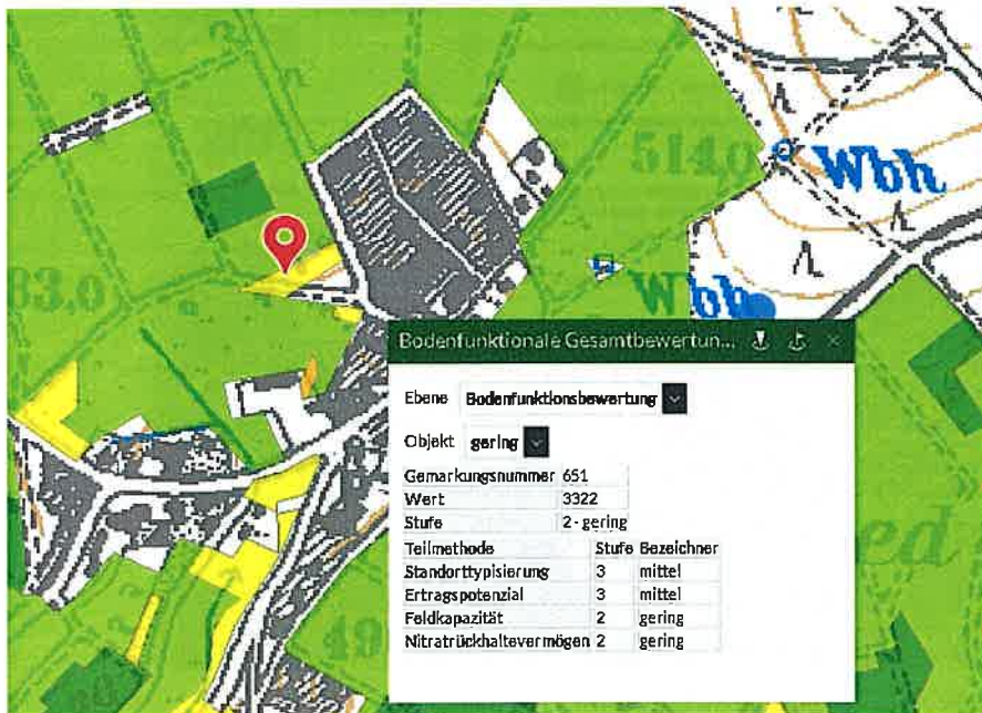
Abb. 1-3: Auszüge aus dem Bodenviewer Hessen: Bodenfunktionale Gesamtbewertung